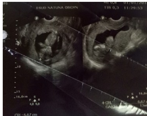
Gambar 1. USG fetomaternal perawatan hari pertama didapatkan janin tunggal intrauterin sesuai masa kehamilan 13 minggu.

minggu dengan portio terbuka. Setelah dilakukan intubasi di ICU, dilakukan juga pemeriksaan Rontgen dada (Gambar 2A) dan didapatkan gambaran perselubungan radioopak disertai reticulogranular pattern di kedua lapang paru, menyimpulkan suatu gambaran interstitial pneumonia. Dari hasil anamnesis, pemeriksaan fisik dan pemeriksaan penunjang, pasien didiagnosis dengan acute respiratory failure due to pneumonia tuberculosis with differential diagnosis SLE+abortus incomplete (G3P2A0 UK 12-13 minggu). Pasien kemudian dirawat di ICU selama 21 hari hingga mengalami perburukan kondisi dan meninggal pada hari perawatan ke 22.